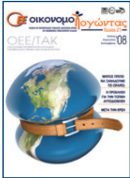
Τιμή τεύχους: €0,01